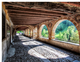
Via Porticata - Averara

Proprio in questi luoghi di confine germoglia la stirpe degli abili frescanti Baschenis , che a lungo operarono anche nelle valli Trentine. Preziose e suggestive sono le opere realizzate dalla famiglia di artisti nella loro terra d'origine.